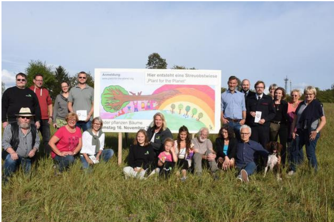
Die Initiatoren haben eine von Sabine Rau gestaltete Plakatwand aufgebaut. Akademie und Pflanzaktion werden von vielen Gruppen unterstützt.